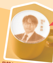
月替わり棋士カプチーン