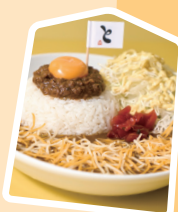
2 種「相掛かり」カレー