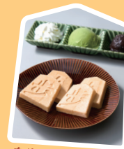
自分で作る駒もなか