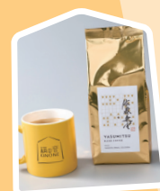
康光ブレンド珈琲