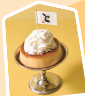
1 目のクラシックプリン

社長をはじめプロントには将棋好きメンバーがおり、将棋部もあります。メニュー開発にも将棋ファンがおります。